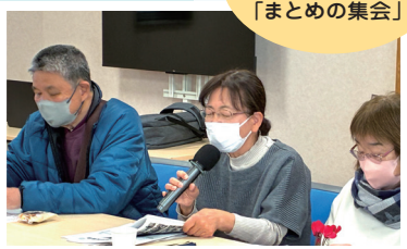
山陽小野田・美祿・下関・厚南ブロック 「組合員交流集会 in 米子」の報告