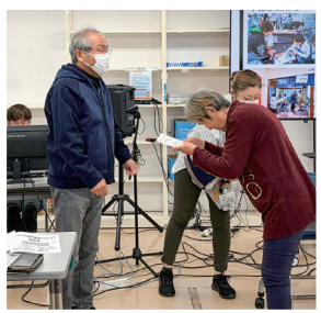
宇部・山口・防府ブロック 月間目標達成表彰