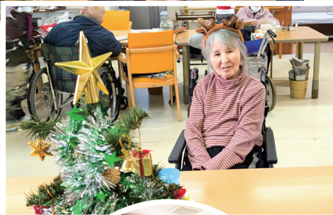
盛り上がったビンゴ大会