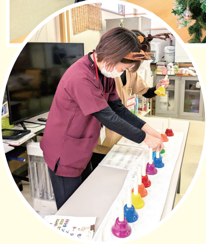
▲ハンドベルを披露!