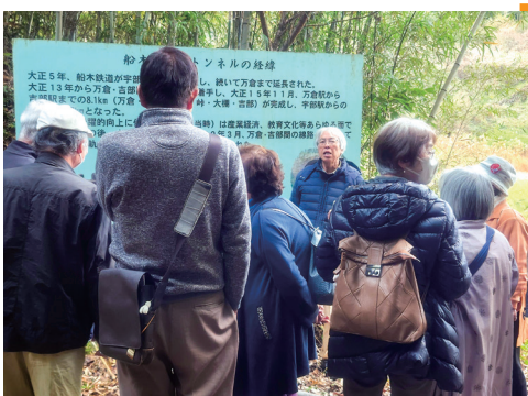
▲船木鉄道トンネル跡地フィールドワークの様子

閉会のあいさつと記念撮影の後は、戦時中に吉部村住民が国策から鉄道を守るために反対運動を行ったといわれる船木鉄道跡まで歩き、現場を見て終わりました。高齢者のパワーで学びのつまったつどいになりました。