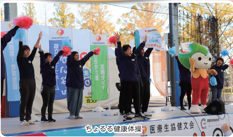
ちよるる健康体操 医療生協健文会