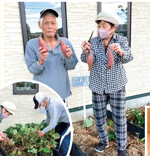
▲立派なさつま芋が採れました！

畳二畳分の広さのたんぽぽ農園でさつま芋を収穫し、芋あんの源氏巻と芋けんぴを作って食べました。初めて作ったさつま芋でしたが、とてもおいしかったです。