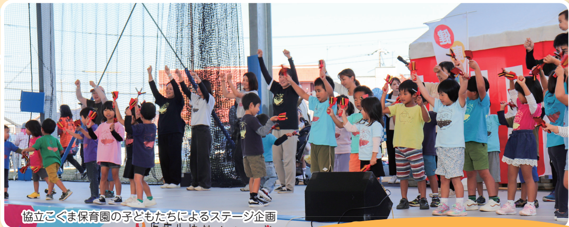
協立こぐま保育園の子どもたちによるステージ企画