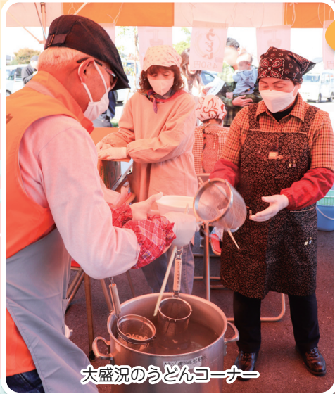
大盛況のうどんコーナー