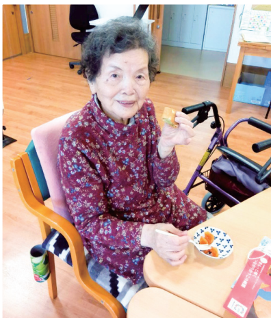
▲おいしくいただきました♪