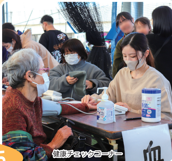
健康チェックコーナー