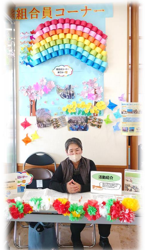
組合員コーナーのデコレーションも桜が満開ですよ♪

日によって出会える方、成果も違いますが、来院患者さんから地域活動への参加に少しでもつながればと声をかけ続けています。