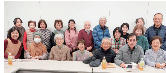
防府市・キリンレモンスタジアムにて(1月24日)