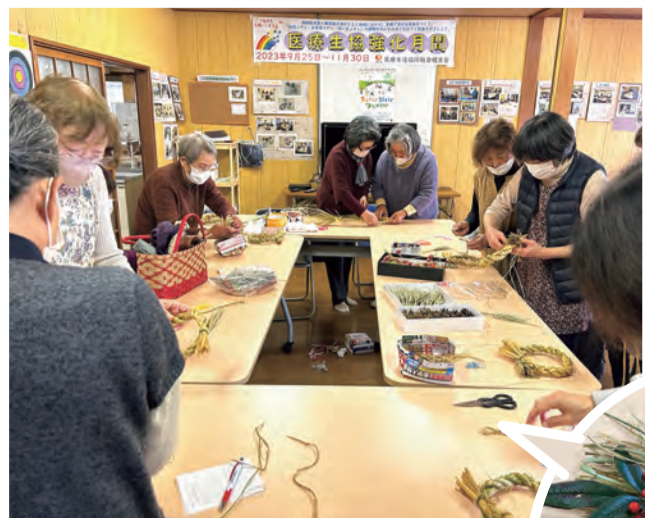
12月6日「サロンにじ」でしめ縄をつくりました