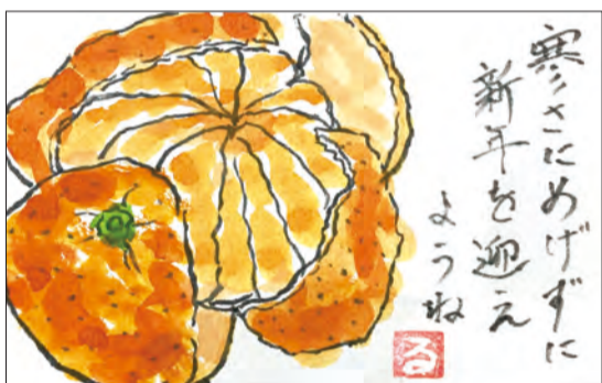
作者 北村 るみさん