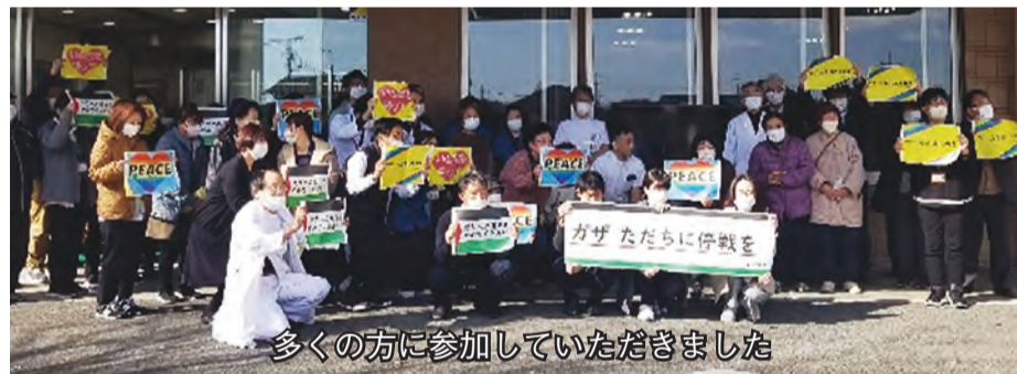
多くの方に参加していただきました

わたしたちにできることは、この事実を知ること。そして、小さくても即時の停戦の声を上げていき、政府に呼びかけることです。(まちづくり組合員活動支援部)