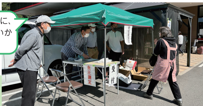
▲まるき小羽山店 (宇部市中山)