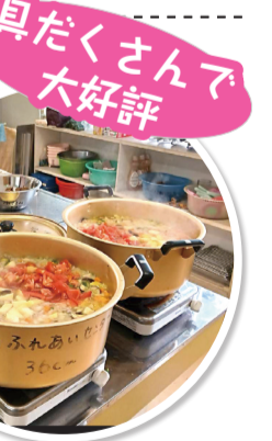
具たくさんで 大好評

「もやい」のこれから ①お弁当方式を止め、食事提供に戻すかどうか ②以前打診のあった「食