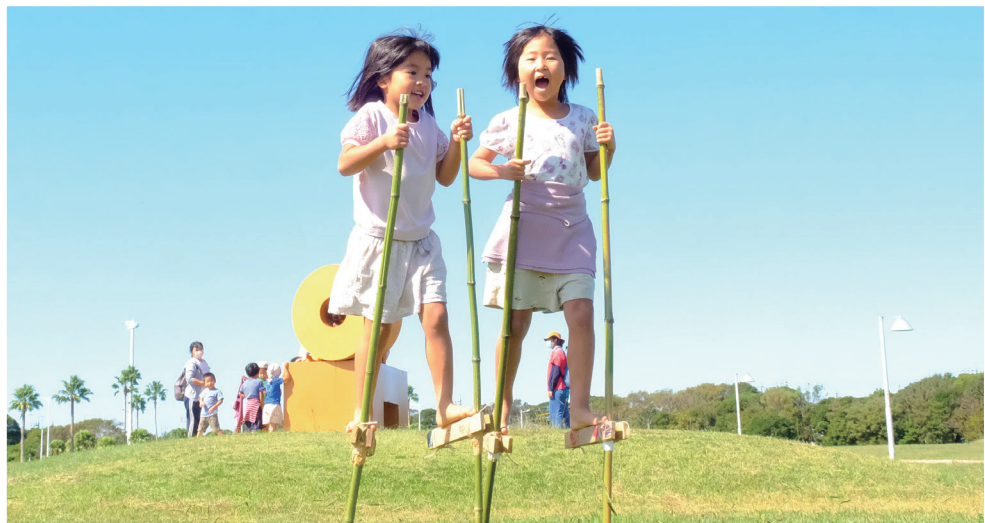
キンキンきれいな秋の空。