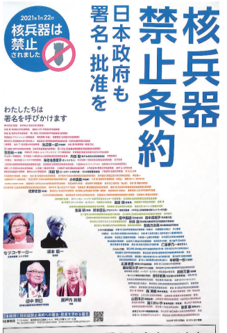
「宇部協立病院」は署名を呼びかけます。