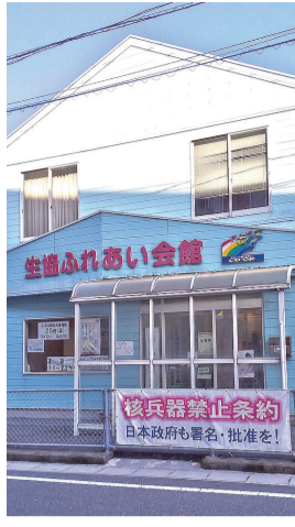
ふれあい会館・反核横断幕