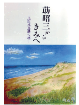
あさひから きみへ