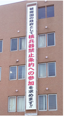
宇部協立病院・垂れ幕

※ 平和行進はコロナ禍の開催のため、各地域によって実施方法が異なる場合があります。 ※ 感染予防対策・熱中症予防対策を万全にして参加しましょう。