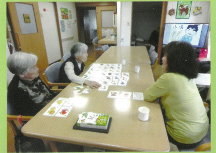
意外と難しい脳トレカード

普段は穏やかな方も真剣な眼差し！全身の筋肉を使うので楽しみながらリハビリが出来ます