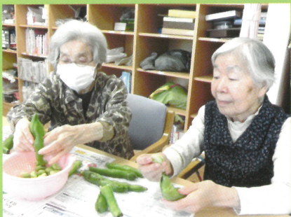
そらまめ頂きます！

今後もコロナの感染予防対策をしっかり行い、利用者様の健康状態を確かめつつ日々の生活を楽しみながら過ごすことになりそうです。