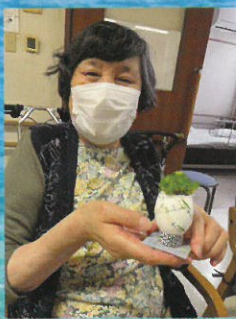
たまごの殻に流行りの 多肉草を植えてみまし た。