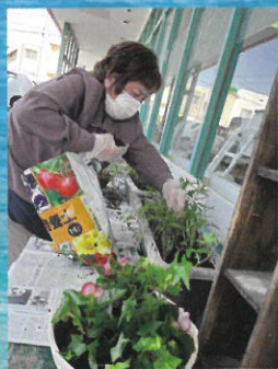
お花の植え替え 利用者さんが大活躍