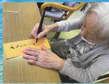
七夕の短冊 願いが届きますように・・・