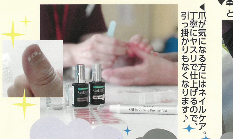
爪が気になる方にはネイルケア。引っぱりやすくなるので仕上げられます。