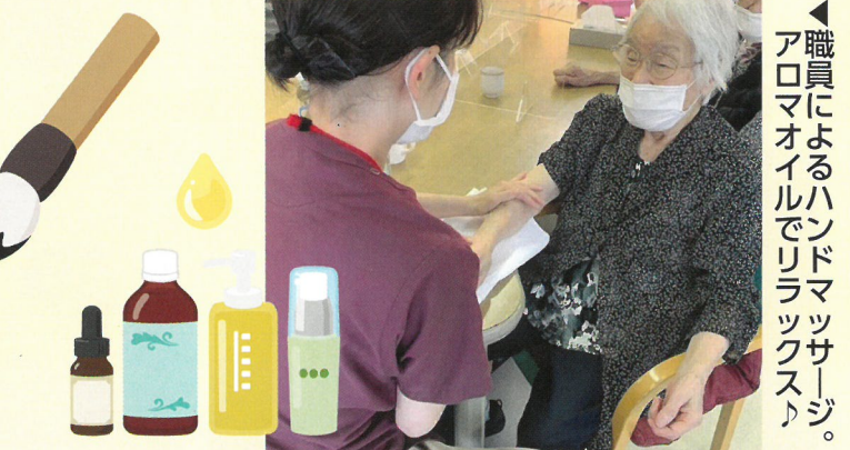
職員によるハンドマッサージ。アロマオイルでリラクゼーション。