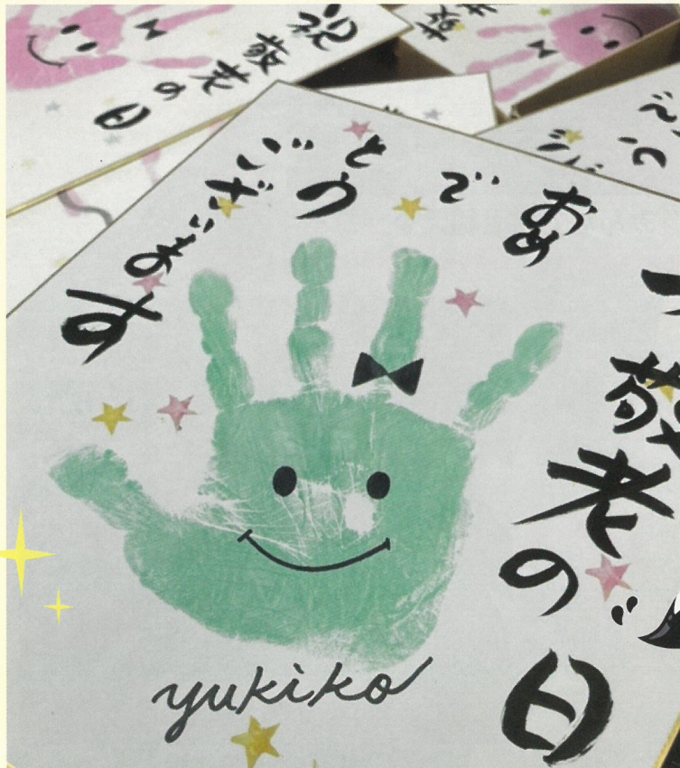
▲敬老の日には、ご本人の手形や足形で作った色紙アートをプレゼント！

朝と夕の寒暖差が激しくなってきましたが、皆さまお変わりありませんか。コロナによる制限の中でも楽しく過ごして頂きたい！と、在宅介護福祉事業部では様々なイベントを企画・開催しています。各事業所より届いた写真をご紹介します！